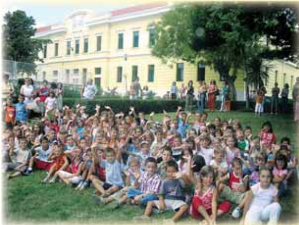
Jubilarna muška i ženska pučka škola 1911. godine