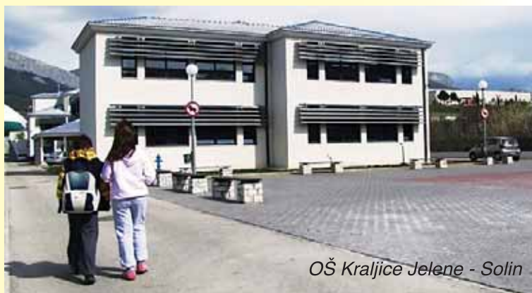
OŠ Kraljice Jelene - Solin

Jezična podloga Judite je splitska čakavština i štokavski leksik te glagoljaška predaja, i po tome je ovo djelo navijestilo jedinstvo hrvatskoga jezika, a epohalna važnost toga spjeva leži u spoznaji da je Marulić hrvatski jezik primjerio europskim pjesničkim standardima.