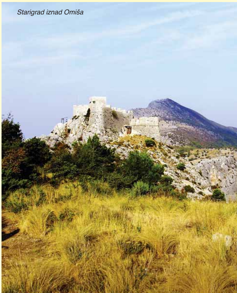
Starigrad iznad Omiša