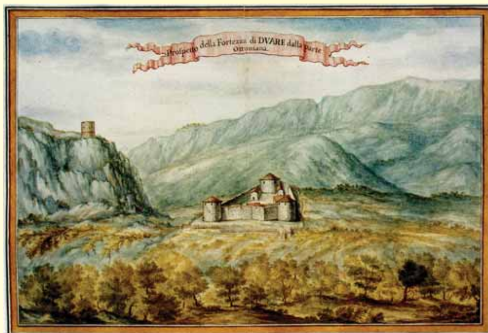
tvrđava Zadvarje početkom 18. stoljeća