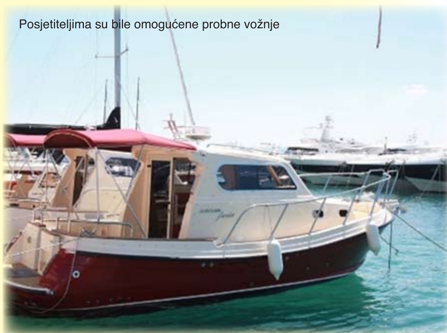
Posjetiteljima su bile omogućene probne vožnje

Agencija za razvoj Splitsko-dalmatinske županije sudjelovala je na Danima hrvatske male brodogradnje. Viša stručna savjetnica iz Agencije za razvoj SDŽ, Mihaela Tomašević, predavanjem na temu „EU fondovi – mogućnosti za poduzetnike“ predstavila je EU pretrpripustne programe pomoći i EU fondove koji će nam biti na raspolaganju ulaskom u punopravno članstvo Europske unije. Poseban naglasak stavljen je na EU programe u kojima poduzetnici imaju mogućnost sudjelovati na projektima kao projektni partneri ili suradnici te na taj način unaprijediti svoje poslovanje.