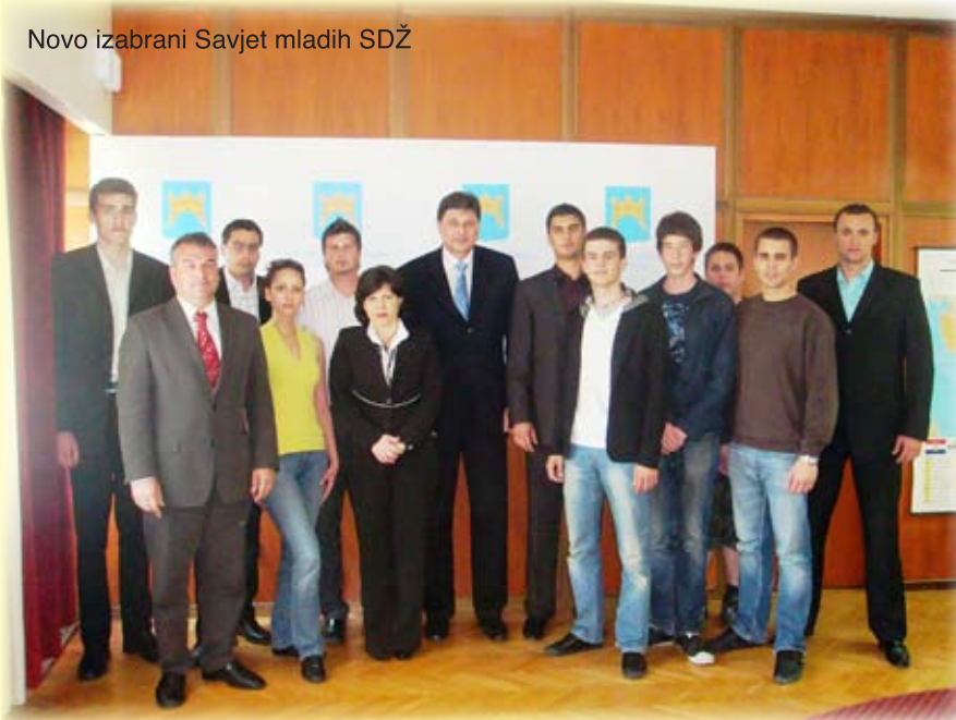
Novo izabrani Savjet mladih SDŽ

Savjet mladih, odmah nakon svog konstituiranja organizirao je 18. lipnja skup gradonačelnika i načelnika gradova i općina Splitsko-dalmatinske županije. Tema skupa bila je uključivanje mladih u rad jedinica lokalne samouprave. Tako su točke dnevnog reda bile: Zakonska obveza osnivanja savjeta mladih u općinama i gradovima Splitsko-dalmatinske županije, te dodjeljivanje prostorija mladima, udrugama mladih i za mlade u sportsko-rekreacijske, kulturne i obrazovne svrhe sa rasporedom korištenja istih u općinama i gradovima Splitsko-dalmatinske županije, te pretvaranje školskih prostora u multifunkcionalne odnosno u svojevrsne centre okupljanja mladih.