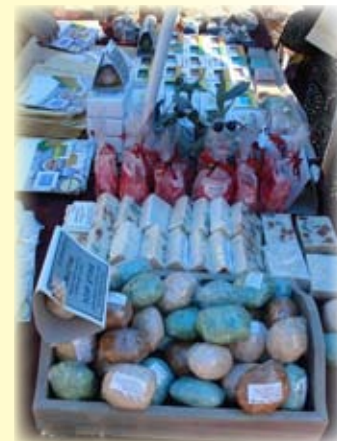
Proizvodi izloženi na manifestaciji