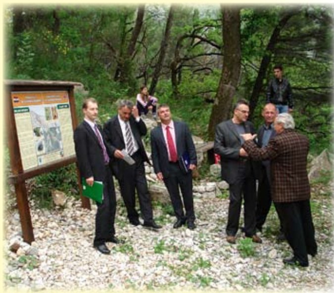
Otvaranje tematske staze