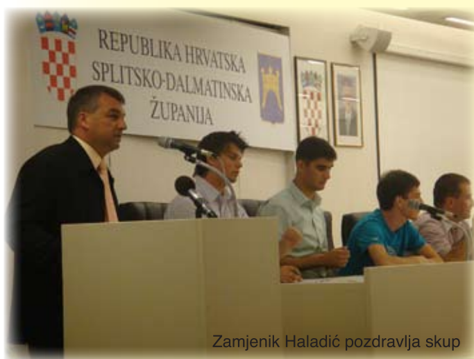
Zamjenik Haladić pozdravlja skup

Županijski savjet mladih također je predstavio svoje aktualne projekte: sufinanciranje putnih troškova učenicima i studentima općina i gradova Splitsko-dalmatinske županije te humanitarni projekt «Dobri ljudi-djeci Hrvatske» za financiranje polica životnog osiguranja korisnicima Domova za djecu bez odgovarajuće roditeljske skrbi.