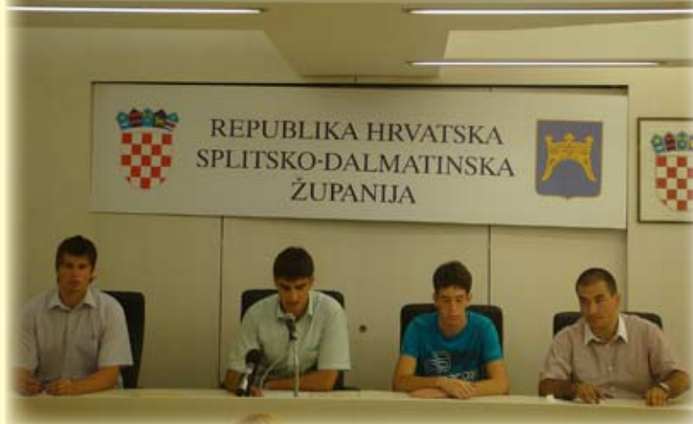
Skupu su se odazvali brojni čelnici općina i gradova, te ustanova u SDŽ